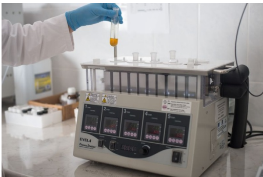
Platforma de cristalizare la scală mare Eyela PPS - 5511