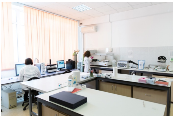
Laboratorul de Cristalizare și Polimorfism

(ii) platforma de cristalizare la scală mare Eyela PPS - 5511 cu cinci reactoare de sinteză, ce permite efectuarea experimentelor în paralel în condiții de temperatură controlate pentru fiecare reactor în parte