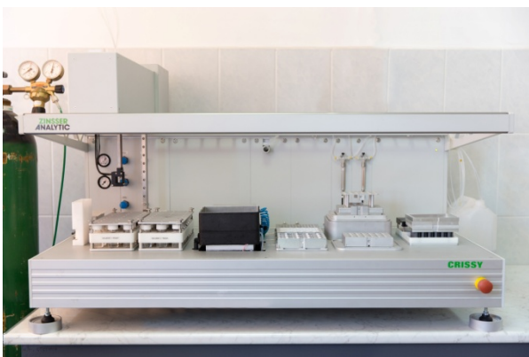
Platforma de cristalizare paralelă la scală mică - Zinsser Crissy Light XL